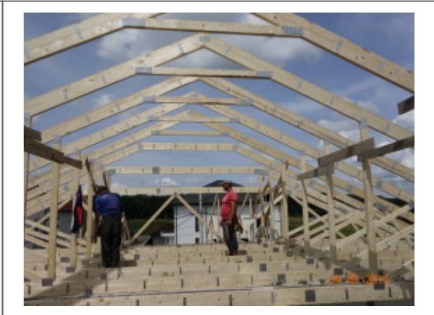
3. Placi multicui Posi Strut pentru planseu (inlocuieste placa de beton).