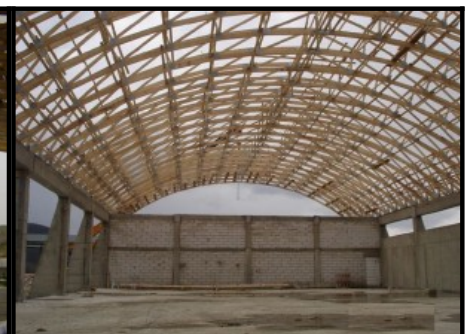
Hale din lemn si depozite din lemn cu ferme din lemn tip arc de cerc