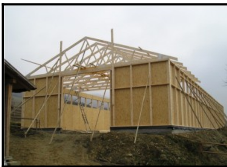
Hale din lemn cu pereti integrali din lemn (framing)

Pentru sectorul industrial oferim 3 variante constructive: