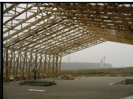
Hale din lemn cu ferme tip portal- cadre din grinzi cu zabrele din lemn